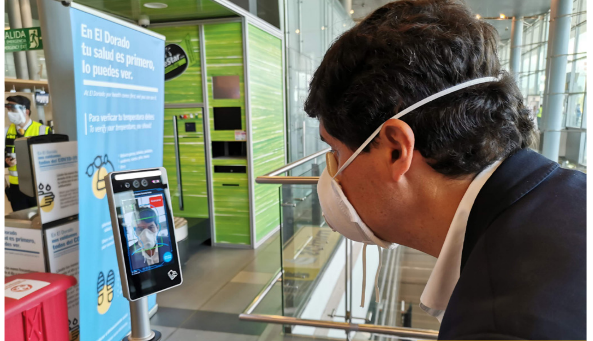
El Dorado implementó tecnología para un tránsito seguro, ágil y cómodo de sus usuarios

Conexión Pacífico 2 y Malla Vial del Meta están certificadas bajo la norma internacional ISO 45001:2018 para sistemas de gestión de seguridad y salud en el trabajo.