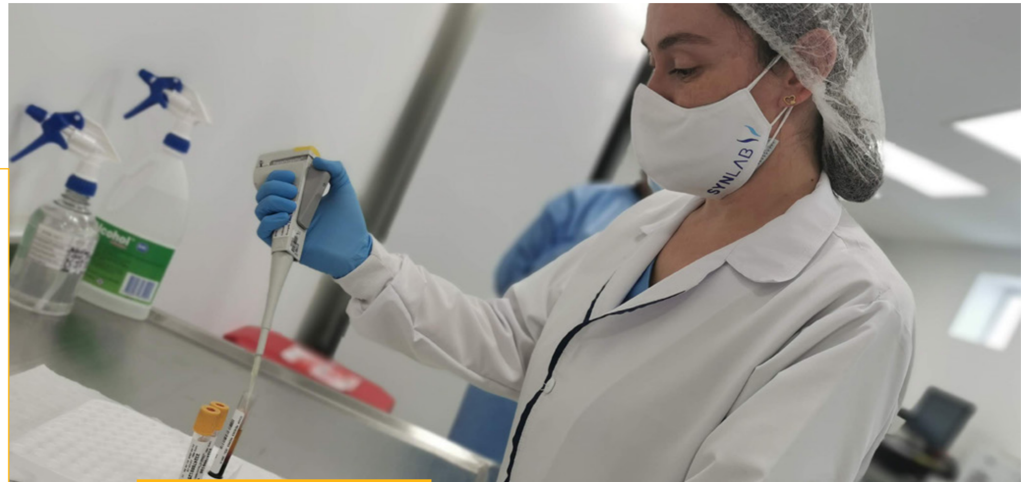
Test center en El Dorado para la realización de pruebas de detección de COVID-19

(403-6) En Aprendemos Siempre, la formación a los colaboradores es una estrategia clave de prevención. Desde su ingreso contamos con un programa de inducción para el conocimiento del sistema de gestión de seguridad y salud en el trabajo, así como los derechos, deberes, responsabilidades, lineamientos y procedimientos que velan por la ejecución segura de las actividades de acuerdo con cada cargo. Este ejercicio se refuerza año a año para generar conciencia y consolidar así la cultura del autocuidado.