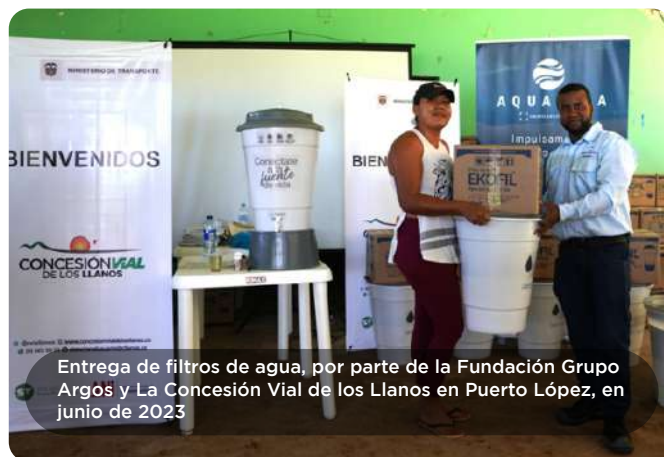
Entrega de filtros de agua, por parte de la Fundación Grupo Argos y La Concesión Vial de los Llanos en Puerto López, en junio de 2023