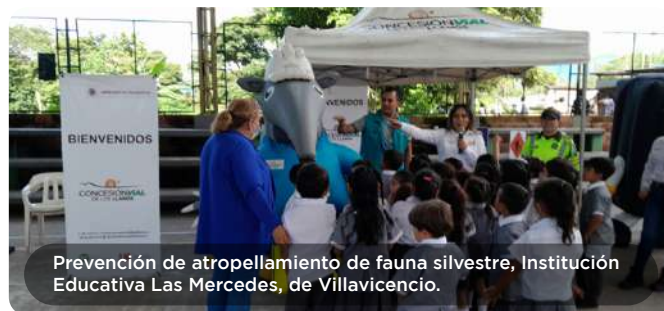
Prevención de atropellamiento de fauna silvestre, Institución Educativa Las Mercedes, de Villavicencio.

De manera complementaria, se instalaron dos pasos de fauna aéreas en colaboración con la autoridad ambiental Cormacarena, ubicados en el corredor vial Villavicencio - Granada y en el corredor vial Puerto López - Puerto Gaitán, con el objetivo de mejorar la conectividad ecológica de los corredores.