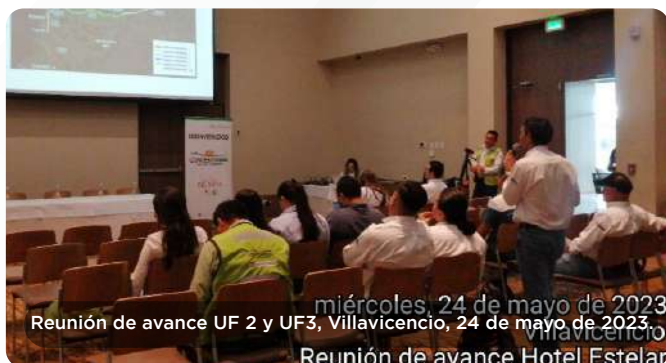
miércoles, 24 de mayo de 2023 Reunión de avance UF 2 y UF3, Villavicencio, 24 de mayo de 2023. Reunión de avance Hotel Estelar

Generación de Empleo: Se crearon un total de 1.379 oportunidades de vinculación laboral, con 109 personas contratadas directamente por el Concesionario y 1.270 a través de empresas contratistas. Es importante destacar que el 86.4% del personal contratado residía en el área de influencia del Proyecto, lo que contribuyó significativamente a la generación de nuevas fuentes de ingreso en la región.