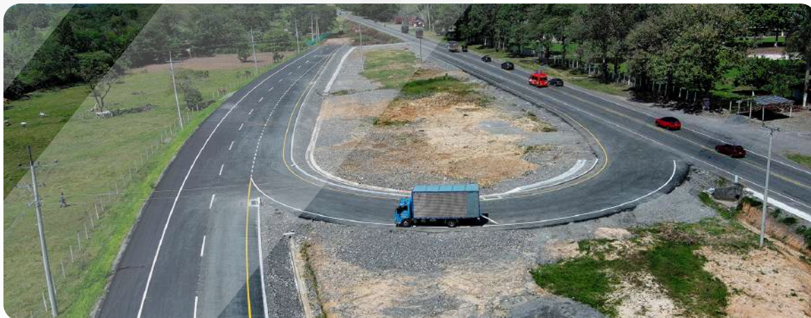
Avance construcción segunda calzada K10+484 a K11+140/656 m

En la Unidad Funcional 3, en la construcción de la segunda calzada se concluyó el tramo comprendido entre el K10+484 y el K11+140 con pavimento y señalización, mientras que en el tramo del K11+140 al K11+500 se realizaron actividades de movimiento de tierra. En cuanto a los puentes, en la construcción del Puente Cola de Pato se avanzó con la finalización de 3 de los 4 pilotes en el Estribo 1. Debido al cambio climático en el río Guayuriba fue necesario adicionar una luz al puente y aumentar la longitud de los pilotes.