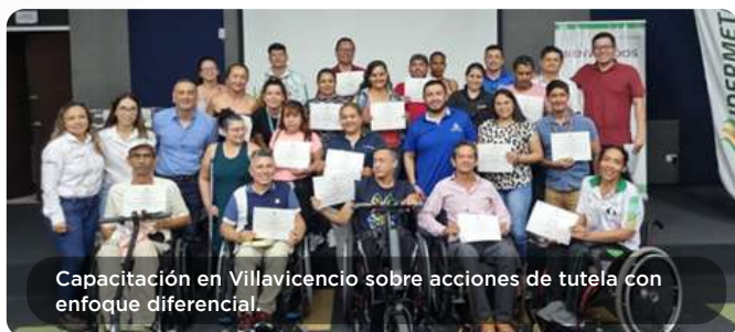
Capacitación en Villavicencio sobre acciones de tutela con enfoque diferencial.

Gestión de Solicitudes: Se atendieron un total de 457 solicitudes, que incluyeron peticiones, quejas, reclamos y sugerencias. Estas solicitudes abordaron una variedad de temas, desde operaciones y mantenimiento hasta infraestructura vial y servicios comunitarios. La atención oportuna y efectiva de estas solicitudes refleja el compromiso del Concesionario con la satisfacción y el bienestar de los usuarios y comunidades locales.