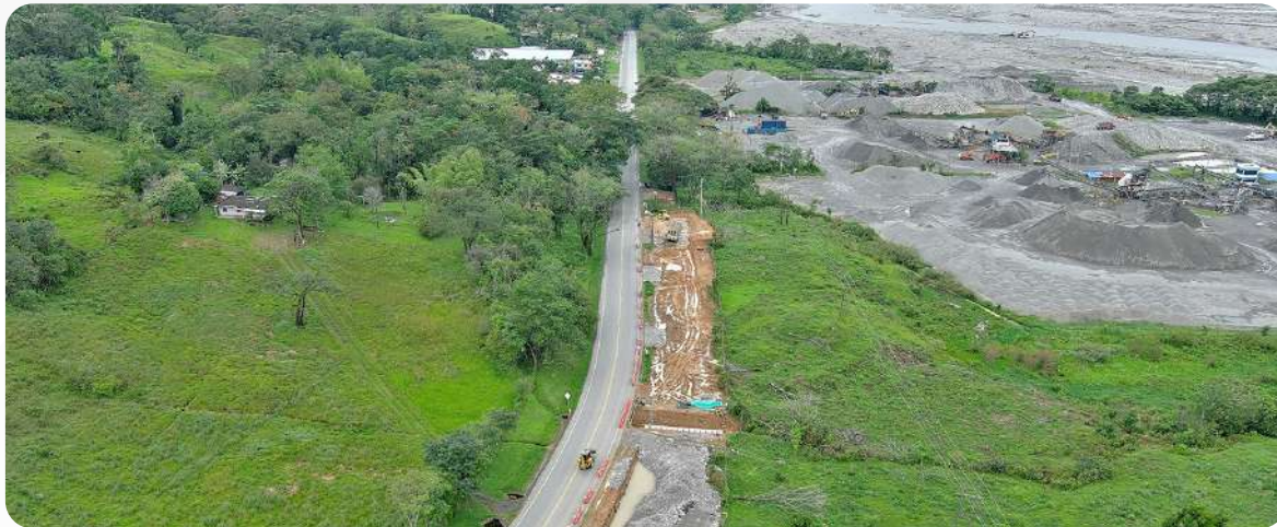
Avance construcción segunda calzada K18+460-K18+975/515 m

En la Unidad Funcional 2, se lograron avances importantes en la construcción de la segunda calzada en varios tramos, con actividades de movimiento de tierra y afirmado, subbases y bases. Asimismo, en los puentes, se destacó el progreso en el Puente Chupao donde se finalizó la cimentación y superestructura. De manera similar, en el Puente Sardinata se avanzó en la cimentación y se completaron 2 de los 3 pilotes previstos para el Estribo 2.