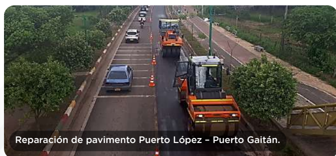
Reparación de pavimento Puerto López - Puerto Gaitán.

En conclusión, todas las actividades y acciones implementadas demuestran nuestro compromiso con la calidad y la eficiencia de la gestión del mantenimiento vial, así como con la satisfacción de nuestros usuarios, vecinos del proyecto y demás clientes de la Organización. Seguiremos trabajando para mantener y optimizar el estado de la infraestructura buscando la excelencia, las buenas prácticas y la innovación para garantizar el cumplimiento continuo de los estándares de calidad y niveles de servicio.