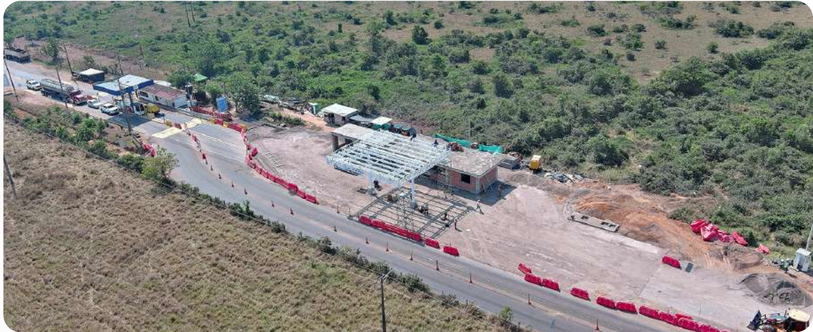
Peaje Yucao K98+180