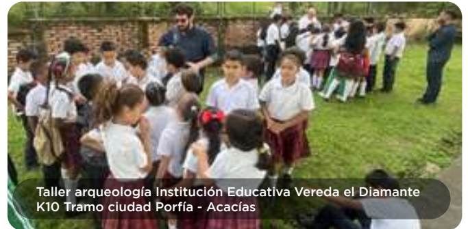
Taller arqueología Institución Educativa Vereda el Diamante K10 Tramo ciudad Porfía - Acacias

Con relación al plan de manejo de arqueología el proyecto recibe visita de funcionario del Instituto Colombiano de Antropología e Historia (ICANH) los días 27 y 28 de noviembre de 2023, quienes realizaron seguimiento a la implementación de las acciones consignadas en dicho plan de manejo al tramo Acacias-Granada.