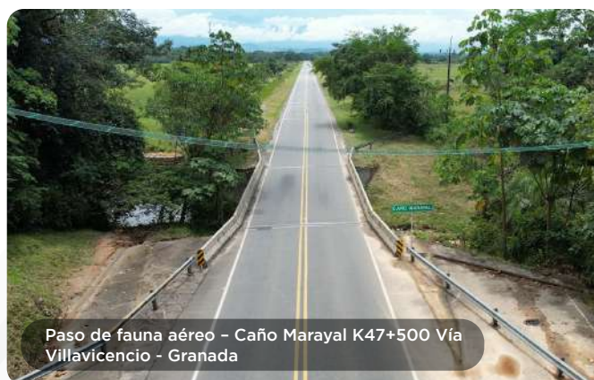
Paso de fauna aérea - Caño Marayal K47+500 Vía Villavicencio - Granada