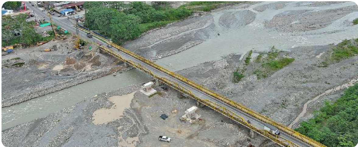
Puente río Guamal

En la Unidad Funcional 1, se registró un progreso significativo en la construcción del Puente sobre el río Guamal. Se completó la cimentación de las pilas 3, 4, 5, 6 y el estribo del costado hacia Granada, junto con avances en la instalación del encofrado para la viga cajón 3. Además, en el peaje Iracá (K68+500), se finalizaron las actividades preliminares y el descapote, preparando el sitio para la construcción. Por último, los tramos contratados en el Broche Humadea (K44+150 al- K44+995 y K45+060 -al K45+750) se concluyeron con pavimento y señalización, adicionalmente, se encuentra en ejecución el urbanismo y quedando pendiente el mejoramiento de la vía en los extremos del antiguo broche.