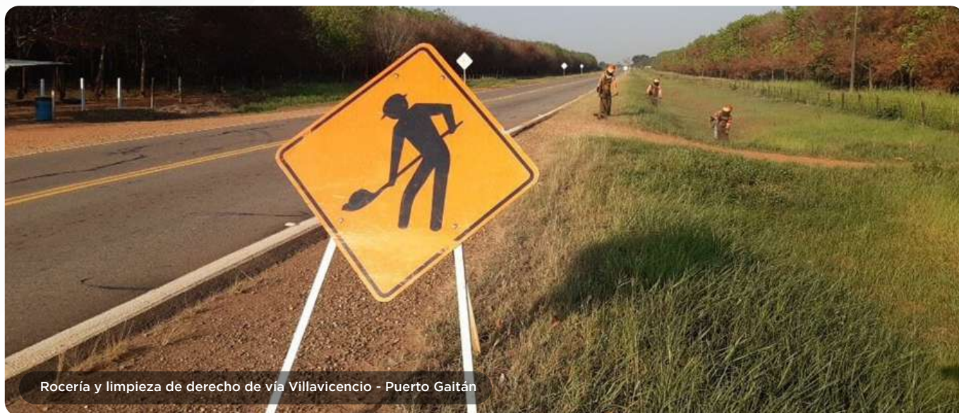
Rocería y limpieza de derecho de vía Villavicencio - Puerto Gaitán

Con ocho empresas conformadas con mano de obra no calificada de las zonas de influencia del proyecto se realiza de manera permanente la rocería y la limpieza de la infraestructura a lo largo de los 260 km de carretera que están a cargo del Concesionario; también, son importantes los trabajos de reparación puntual del pavimento a través del sello de fisuras y del parcheo puntual para asegurar un buen estado de la superficie de rodadura. La limpieza de obras de drenaje como alcantarillas y canales permitió mejorar la hidráulica en algunos sectores, evitando inundaciones y erosiones. Con colaboradores directos que hacen parte de la Dirección de Mantenimiento se llevaron a cabo 176 operativos y jornadas en el año para la recolección de basuras, material vegetal, escombros, así como el retiro de animales y semovientes sueltos que pueden causar accidentes viales.