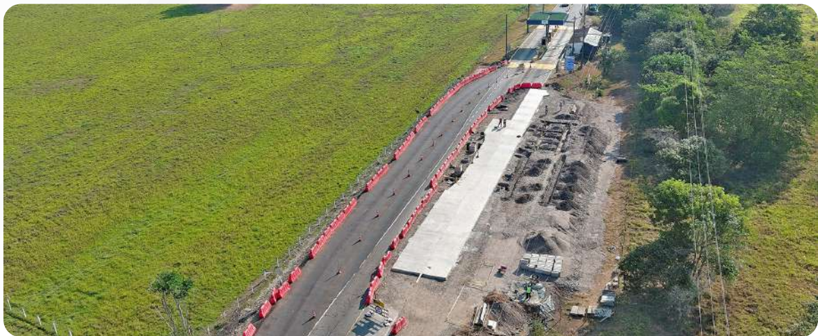
Peaje Casetabla K16+068

En cuanto a las obras de la unidad funcional 5, el Concesionario ha presentado una solicitud para que se le conceda un Evento Eximente de Responsabilidad dados los retrasos presentados en la definición del trazado en el sector de Puente Amarillo por parte de la ANI. Por otro lado, la unidad funcional 6 está inmersa en una controversia derivada del incumplimiento por parte de la Agencia Nacional de Infraestructura (ANI) de lo acordado en la cláusula primera del Orosí 12, fechado el 24 de enero de 2022.