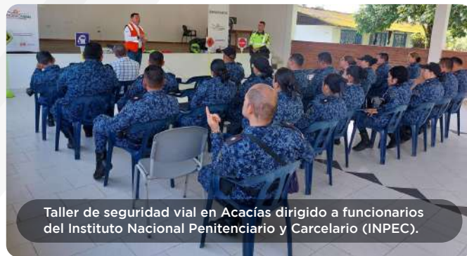
Taller de seguridad vial en Acacías dirigido a funcionarios del Instituto Nacional Penitenciario y Carcelario (INPEC).

Becas Universitarias: A través del programa becas para el desarrollo regional de la Fundación, se otorgaron becas universitarias a 2 estudiantes destacados de instituciones educativas locales, como parte del compromiso del Concesionario con el desarrollo educativo regional. Estas becas brindan oportunidades de educación superior a jóvenes talentosos y contribuyen al fortalecimiento del capital humano en la región.