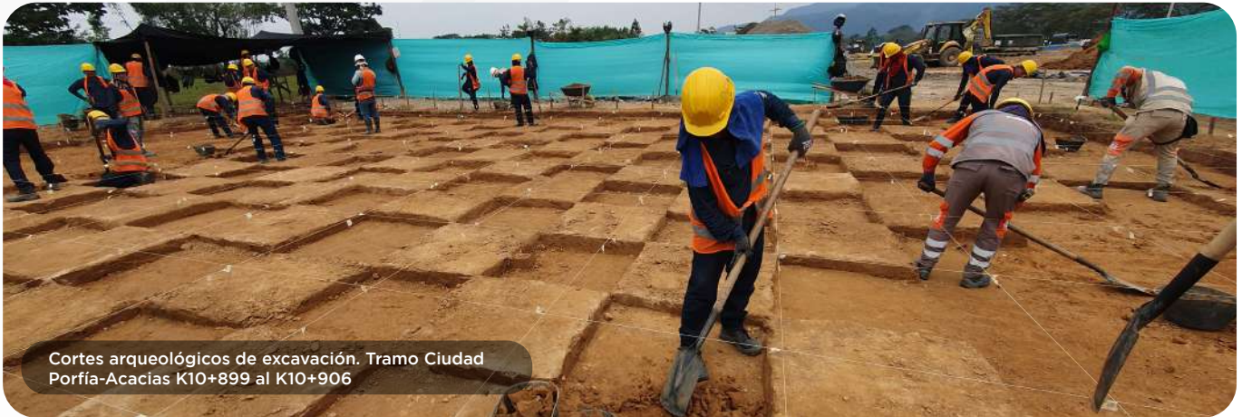
Cortes arqueológicos de excavación. Tramo Ciudad Porfía-Acacias K10+899 al K10+906

En el marco del programa de arqueología preventiva se ejecutó el rescate arqueológico del sitio denominado “La Unión” ubicado en la unidad funcional 3. Entre el 13 de marzo y el 12 de abril de 2023 se llevó a cabo la fase de campo, recuperando un total de 7.708 fragmentos cerámicos, el material fue clasificado y valorado en laboratorio, determinando que los hallazgos corresponden a fragmentos de residuos habitacionales no reconstruibles. Además, se recuperó el material cultural y se dio cumplimiento a las obligaciones de la resolución 602 de 2021.