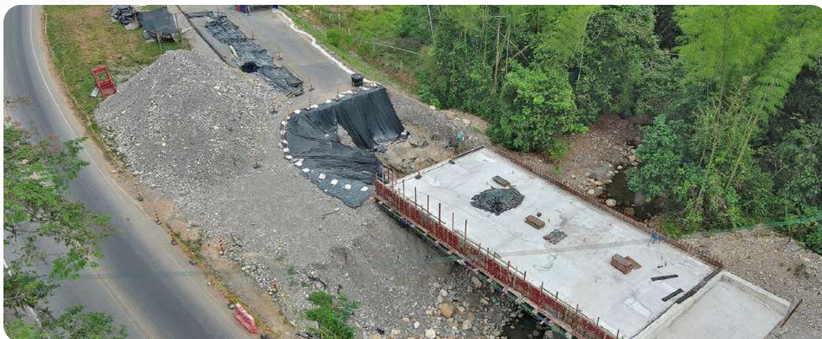
Puente Caño Chupao