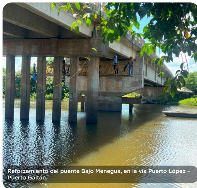
Reforzamiento del puente Bajo Menegua, en la vía Puerto López - Puerto Gaitán.