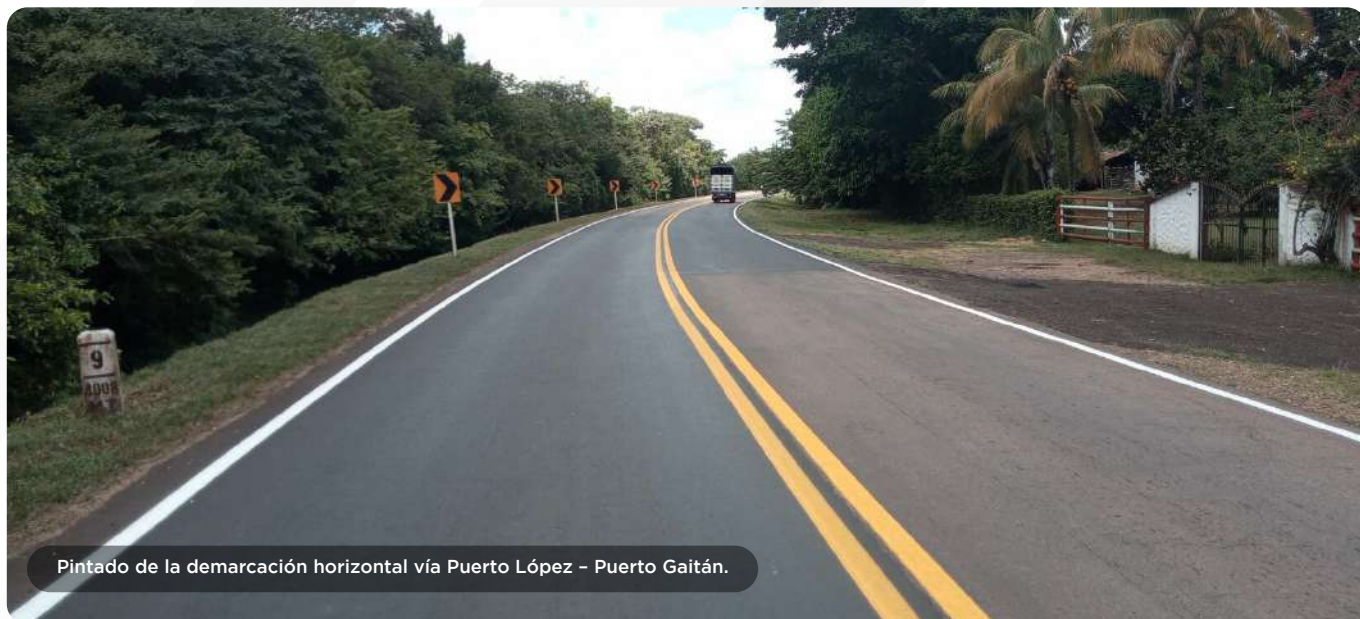
Pintado de la demarcación horizontal vía Puerto López - Puerto Gaitán.