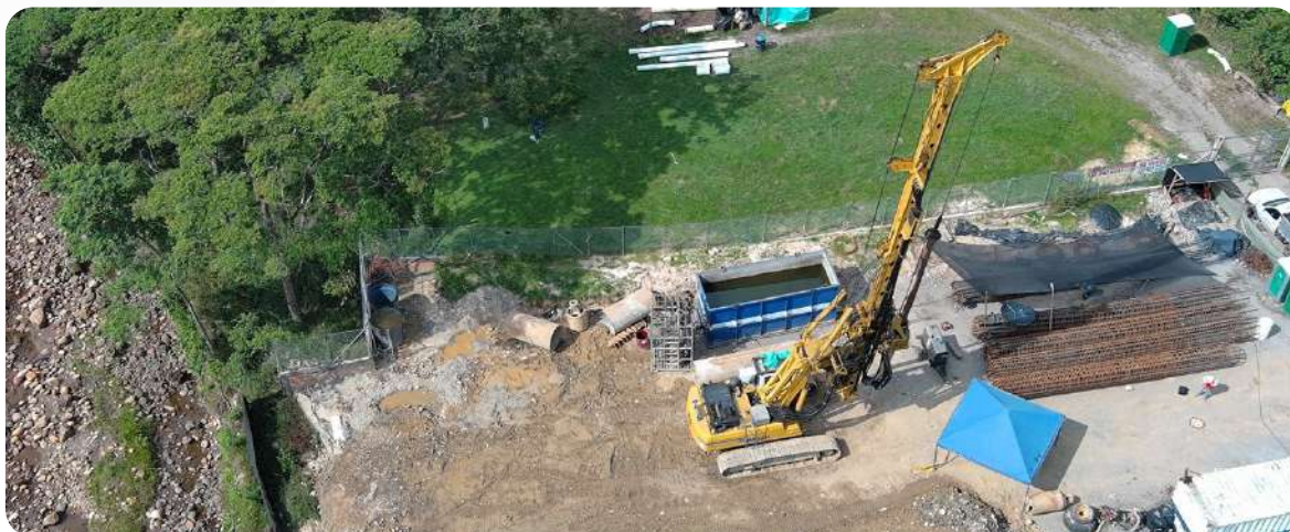
Puente Cola e Pato

Finalmente, en la Unidad Funcional 7-8, se registraron avances notables en la construcción de los Peajes Casetabla K16+068 y Yucao K98+180, así como en el Puente Yucao K100+195 a K100+325, donde se completaron los pilotes y estribos.