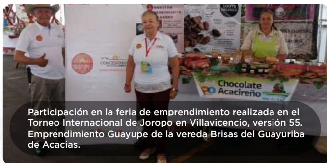
Participación en la feria de emprendimiento realizada en el Torneo Internacional de Joropo en Villavicencio, versión 55. Emprendimiento Guayupe de la vereda Brisas del Guayuriba de Acacias.

Participación Comunitaria: Se llevaron a cabo 34 reuniones de participación comunitaria y 5 reuniones de avance, en las cuales se informó a la comunidad sobre los aspectos técnicos, ambientales y sociales del Proyecto. Estas reuniones proporcionaron un espacio para el diálogo y la retroalimentación entre el Concesionario y las partes interesadas locales, fortaleciendo así la relación de confianza y transparencia.