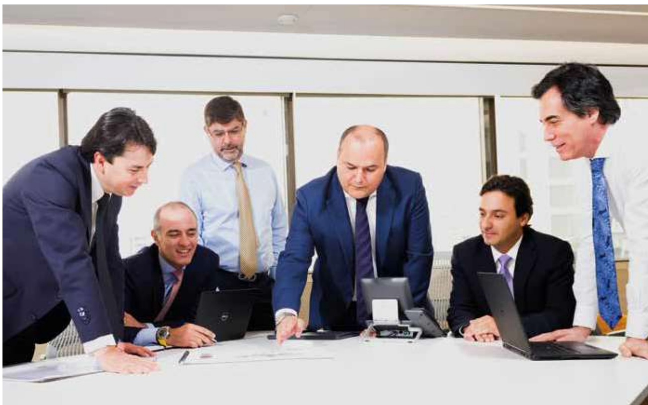
Comité Directivo de Odinsa

La misión de los miembros es aportar su conocimiento y experiencia para enfrentar los retos que se presenten en la sociedad y asegurar la creación de valor a nuestros grupos de interés.