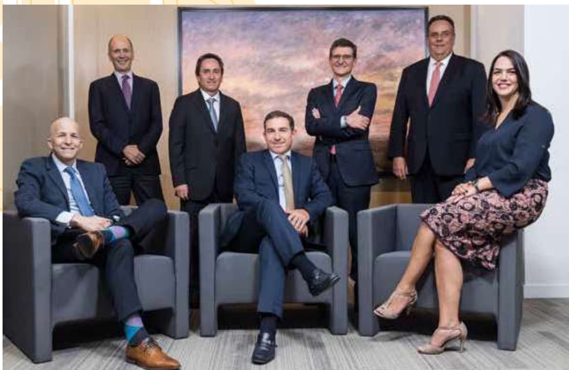
Junta Directiva de Odinsa